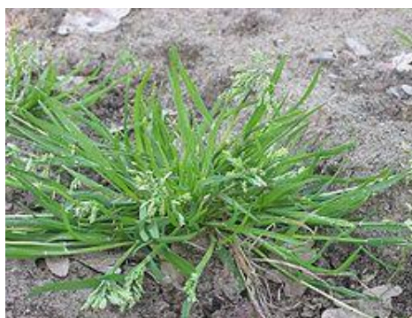
《スズメノカタビラ》