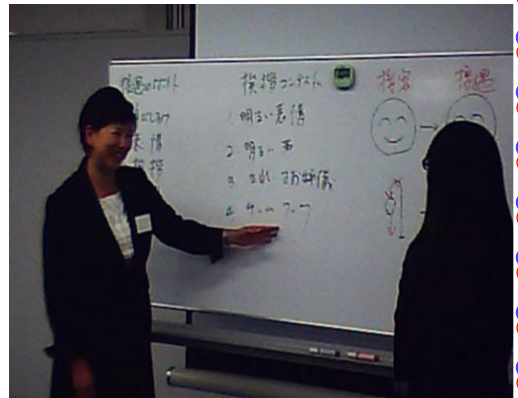
文責 スタッフ 安田

この研修を通して、患者様に対する接し方を見つめ直しました。些細なことでも患者様にとっては不快に感じる事もあるという事等すごく勉強になりました。この研修で学んだことを役立てられるように実践していきたい今日この頃です。