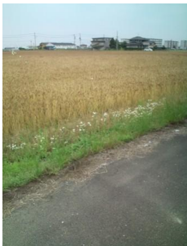
↑ 命の限り飛び回るモンシロ蝶々さんたち

まつ毛の根元に塗ることで、まつ毛を「長く」「太く」「濃く」します。 従来のまばらで短いまつ毛への対処法には、化粧やつけまつ毛からエクステンションまで、さまざまな方法がありましたが、このラティースは「まつ毛の貧毛」という症状を改善するとして、まつ毛用医薬品としては初の FDA 認可を受けた医薬品(処方薬)です。なお、化学療法など副作用で一般的な脱毛と同時にまつ毛の脱毛が発症した患者様にも大きな効果が期待できます。手に入れるにはもちろん医師の処方箋が必要ではあるが、ジェネリック点眼薬を使用して安価にしようとすることも試みられているみたいである。女性の美への飽くなき追求は悪くはありませんが、眼科専門医としてはその他のいろいろな副作用を考えると??である。