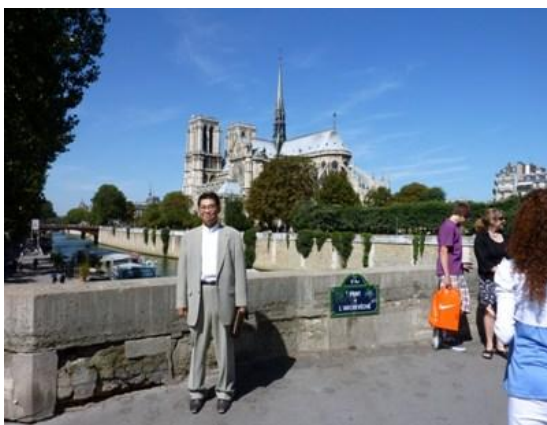
↑事件直後のノートルダム寺院前での記念撮影

それよりも財布を確認させること自体がおかしいのですが、見事なニセ警官とニセ観光客による劇でした。