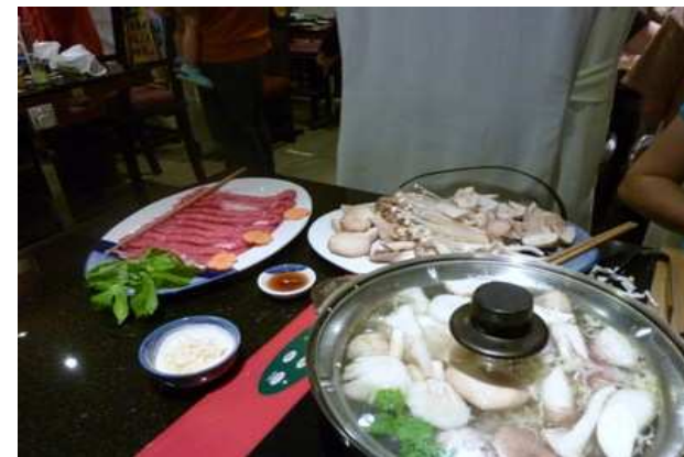
いつも行くBANGKOK「MKgold」のタイスキ

ところで、先日も妻と二人で五回目のタイに行っていました。毎日、好物のタイスキを食べてホテルのフィットネススタジオで無駄な筋トレ三昧をし、とてもエンジョイしてまいりました。最近のマイブームがタイなのです。何故なのかと云いますと、物価が日本の十分の一ぐらいの感覚で安い、治安が日本よりもいい、食事が美味しい、そして、「軽蔑」というタイ語がないように思えるほどの偏らない心でひとに接する仏教の教えが多くの人に在るということです。心が洗われます。=合掌(ワイ)=