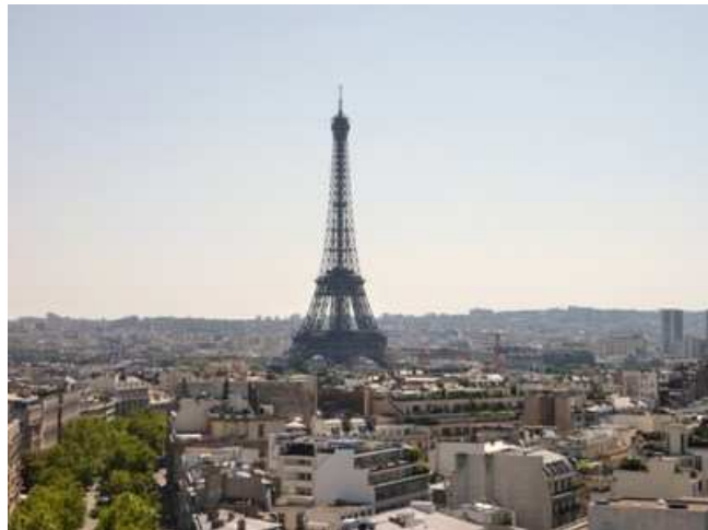
凱旋門屋上よりエッフェル塔を望む